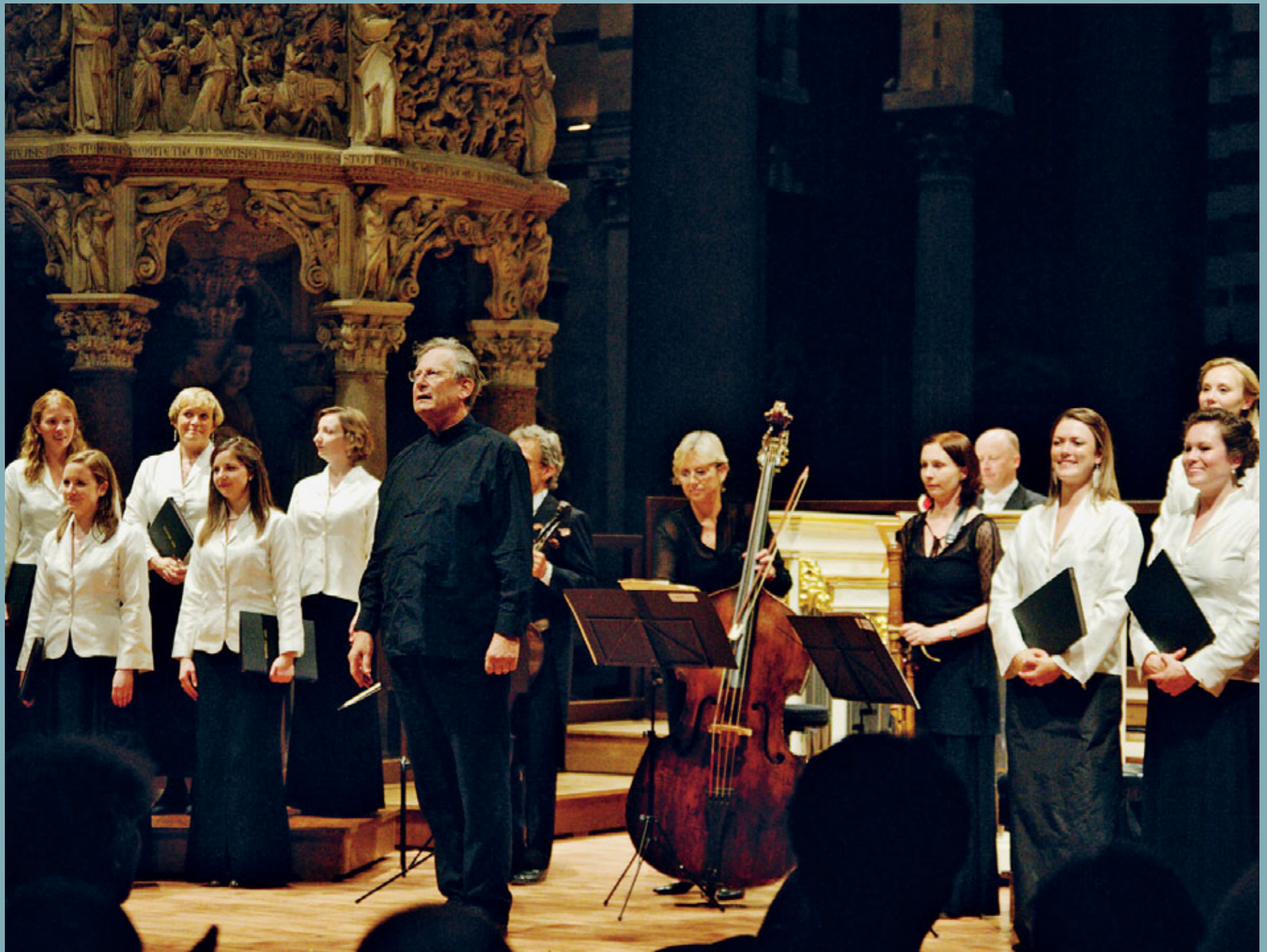
The Monteverdi Choir following a concert of Bach motets, Pisa Cathedral, 28 September 2011